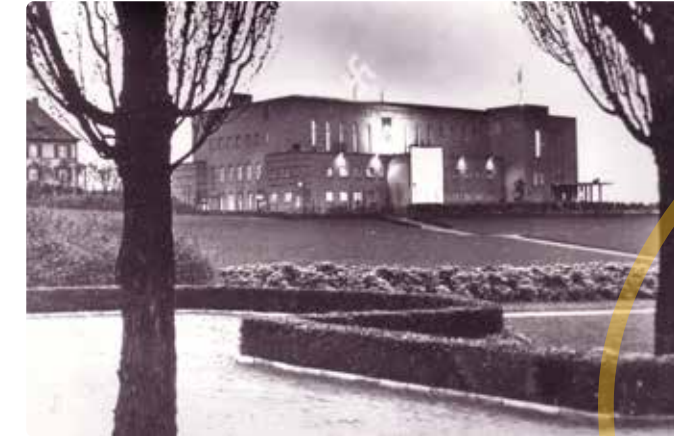
Die Adolf Hitler Halle im heutigen Bürgerpark